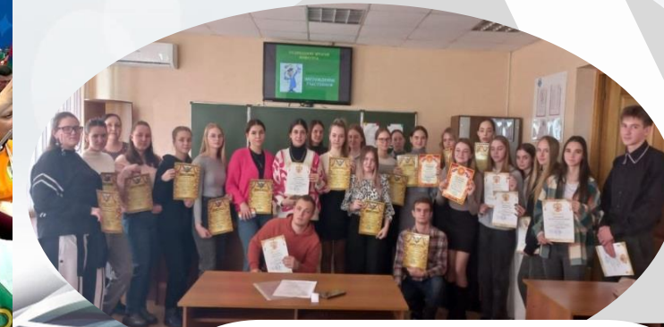
Конкурс профессионального мастерства «Лучший юрист»