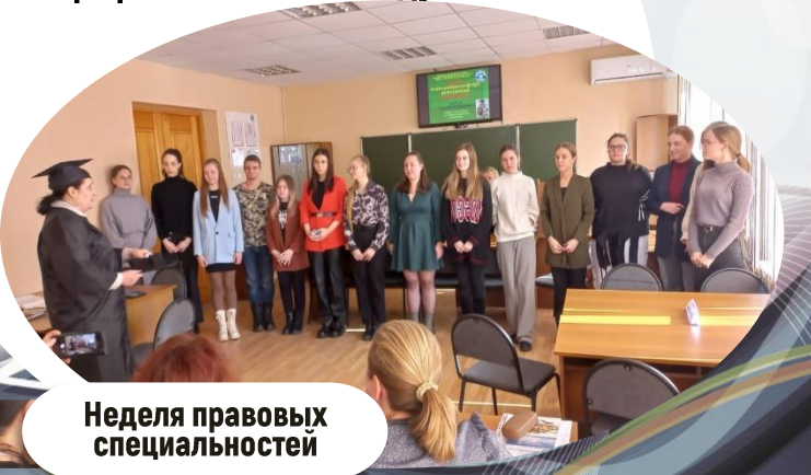
Неделя правовых специальностей