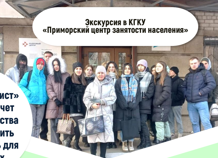
Экскурсия в КГКУ «Приморский центр занятости населения»