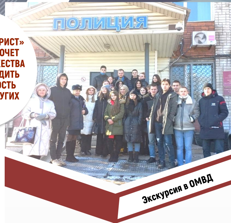
Экскурсия в ОМВД

ПРОФЕССИЯ «ЮРИСТ» ДЛЯ ТЕХ, КТО ХОЧЕТ ДОБИТЬСЯ ТОРЖЕСТВА ЗАКОНА, УТВЕРДИТЬ СПРАВЕДЛИВОСТЬ ДЛЯ СЕБЯ И ДРУГИХ