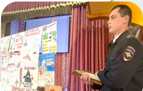
Классный час с начальником отдела по борьбе с мошенничеством