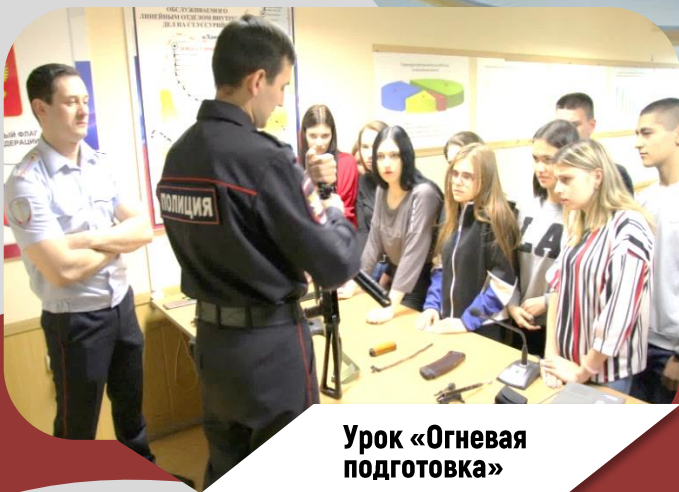
Урок «Огневая подготовка»