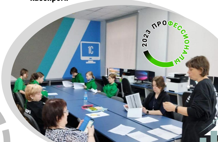
Региональный этап Всероссийского чемпионатного движения по профессиональному мастерству

В процессе обучения студентам предоставляется возможность получения рабочей профессии «Кассир» . Кассир в крупной финансовой организации проводит денежные операции, следит за изменениями на счетах и работает с финансовой базой данных