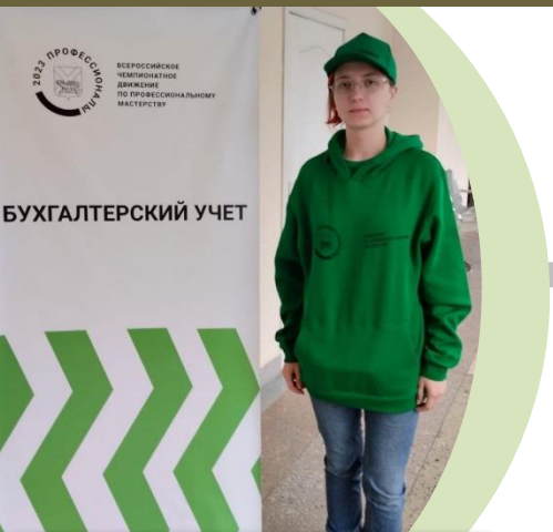
Региональный этап Всероссийского чемпионатного движения по профмастерству «Профессионалы»

• СПЕЦИАЛИСТЫ ПО СПЕЦИАЛЬНОСТИ «ЭКОНОМИКА И БУХГАЛТЕРСКИЙ УЧЕТ» РЕШАЮТ ОПЕРАТИВНЫЕ ЭКОНОМИКО-ОРГАНИЗАЦИОННЫЕ ЗАДАЧИ В ЭКОНОМИЧЕСКИХ И ФИНАНСОВЫХ СЛУЖБАХ ПРЕДПРИЯТИЙ И ОРГАНИЗАЦИЙ В ПОДРАЗДЕЛЕНИЯХ, ОТВЕТСТВЕННЫХ ЗА СТАТИСТИЧЕСКУЮ ОТЧЕТНОСТЬ, БУХГАЛТЕРСКИЙ И НАЛОГОВЫЙ УЧЕТ