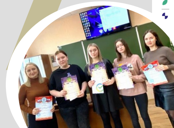
Конкурс профессионального мастерства «Лучший бухгалтер»

ПОТРАТЬТЕ ВРЕМЯ С ПОЛЬЗОЙ – СТРОЙТЕ КАРЬЕРУ!