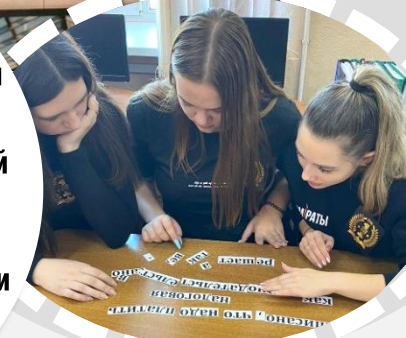
Интеллектуальная игра «Свой бизнес»

В процессе обучения студентам предоставляется возможность получения рабочей профессии «Кассир» . Кассир в крупной финансовой организации проводит денежные операции, следит за изменениями на счетах и работает с финансовой базой данных