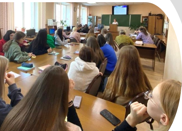
Интеллектуальная игра «Дебет против кредита» (лаборатория «Учебная бухгалтерия»)

Выбрав своей судьбой бухгалтерию, готовьтесь взять на себя все финансовые операции фирмы. В маленьких предприятиях бухгалтер берет на себя не только обязанности рассчитывать бюджет фирмы, выдавать зарплату и вести налоговую документацию, но и роль финансового директора.