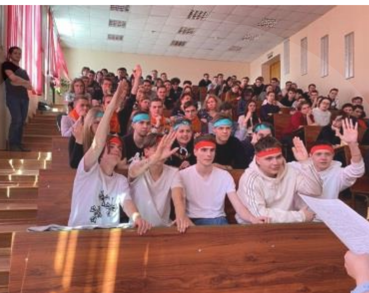
ИНТЕЛЛЕКТУАЛЬНАЯ ИГРА «БРЕЙН-РИНГ»

ВЕБ-РАЗРАБОТЧИК ЗАНИМАЕТСЯ СОЗДАНИЕМ И ДАЛЬНЕЙШИМ ОБСЛУЖИВАНИЕМ САЙТОВ, СЛЕДИТ ЗА ОБНОВЛЕНИЯМИ И НОВЫМИ ТЕХНОЛОГИЯМИ В ЯЗЫКАХ ПРОГРАММИРОВАНИЯ